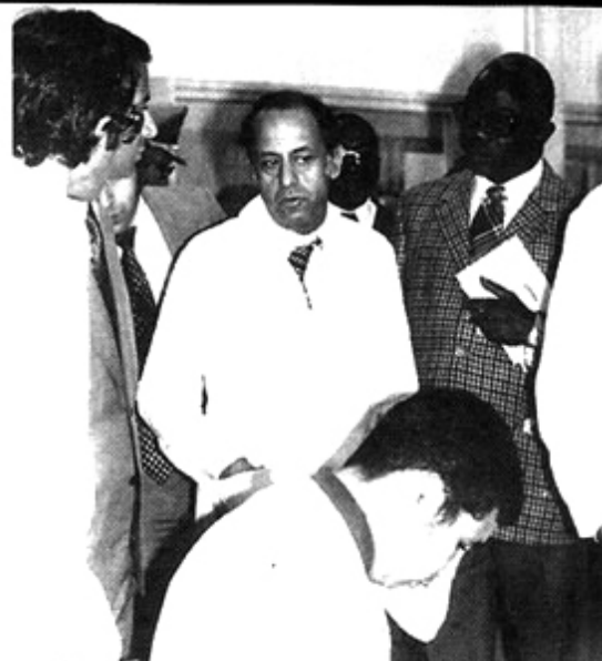
Inauguration du centre d'appareillage de l'Hôpital Kassar-Saïd